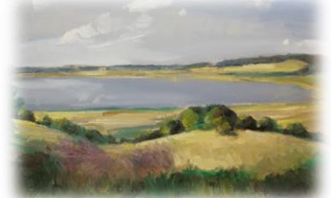
født i Sebbersund 1945